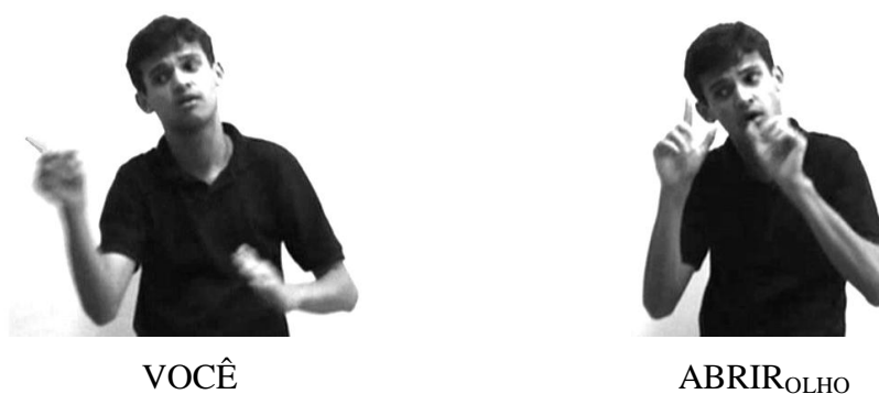
Figura 6: Localizador em discurso direto.

enunciação está presente neste espaço e os sinais são realizados por seu corpo e em seu corpo; a 2ª pessoa também está presente no espaço físico, num ponto logo à frente do enunciador; e os Localizadores servem, neste contexto, para marcar imaginariamente os referentes que faltam: a não-pessoa, isto é, alguém ou alguma coisa e também o lugar ou lugares onde o sujeito da enunciação está, pois o aqui é o espaço onde ele pisa. Este tipo de construção de referência em línguas de sinais funciona também no discurso direto, como na Figura 6 abaixo, em que a mãe dirige a fala a Chapeuzinho (referente imaginário). Assim, o LOC.CHAPEUZINHO, marcado como 2ª pessoa do discurso pelo olhar do enunciador (a mãe de Chapeuzinho), está num ponto próximo a este.