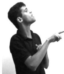
VOCÊ (ou Loc.LOBO)