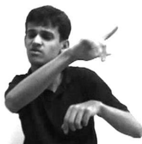
LOC.CASA DA VOVÓ

Já na Figura [5a], temos a categoria dêitica de lugar no LOC.CASA DA VOVÓ, Localizador articulado que indica um ponto distante à frente do interlocutor. Além do LOC.CASA DA VOVÓ, temos nessa figura também um Localizador não-articulado com a categoria dêitica da 2ª pessoa – o LOC.CHAPEUZINHO, realizado pelo olhar à direita, na representação da fala da mãe dirigida a Chapeuzinho, no momento em que ela pede à filha para ir à casa da avó levar doces.