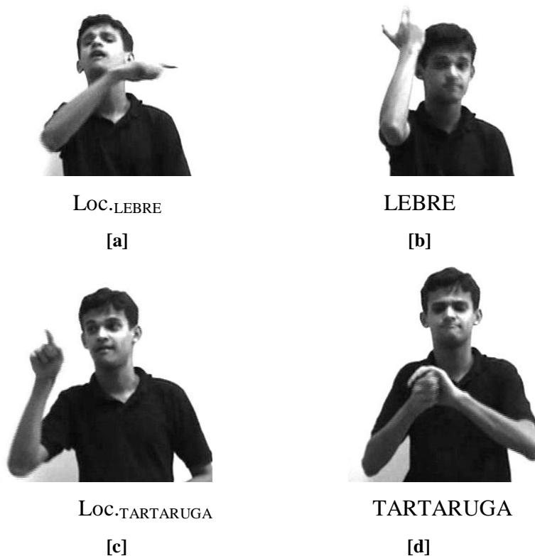
Figura 1: Localizadores articulados.

Neste exemplo, o sujeito informante surdo, falante de libras (SI), que está narrando a fábula “A lebre e a tartaruga”, inicia sua narrativa apresentando as personagens através da realização dos sinais LEBRE e TARTARUGA, marcando juntamente com o sinal de cada animal o ponto no espaço físico que irá corresponder a cada um deles durante toda a narrativa. E assim o faz, retoma esses pontos sempre que se refere a essas personagens, sem trocar esses pontos, por engano, uma só vez.