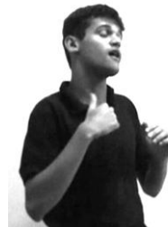
EU (ou Loc.CHAPEUZINHO)