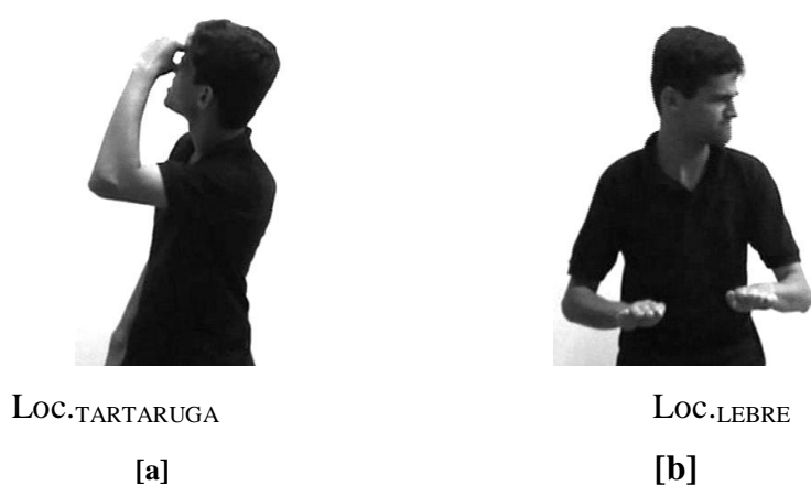
Figura 2: Localizadores não-articulados – direção do olhar.

marcar a mudança da personagem. Na Figura [2a] abaixo, SI gira o corpo para a sua direita, com a mão acima dos olhos, representando a lebre procurando avistar a tartaruga, que ficou para trás. O giro de corpo é para a direita porque o ponto de referência da tartaruga foi marcado à direita. Já na Figura [2b], SI olha para a sua esquerda, indicando que agora é a tartaruga que observa a lebre, que dorme enquanto ela passa. O olhar nesse caso dirigiu-se à esquerda porque o ponto de referência da lebre foi marcado à esquerda. E na Figura [3], verificamos que SI inclina o corpo, movendo-o para a sua direita, alterando também a configuração das mãos e o ritmo do movimento do sinal ANDAR LEBRE , que foi alterado para ANDAR TARTARUGA . Com esta ligeira mudança de posição, o nosso interlocutor procurou indicar a mudança do referente lebre para o referente tartaruga .