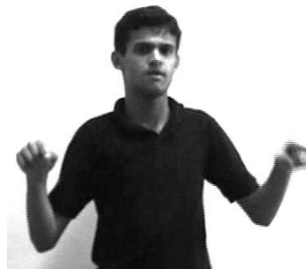
Figura 10: Dois Localizadores indicados ao mesmo tempo.

O fato de os elementos Localizadores estarem presos, no espaço, a referentes específicos cria a possibilidade de se fazer referência aos Locs. simultaneamente, como faz SI na figura abaixo. A Figura [10] mostra SI indicando ao mesmo tempo os LOC.TARTARUGA e LOC.LEBRE, para em seguida reproduzir um diálogo entre essas duas personagens, marcando com um giro de corpo (para a direita e para a esquerda) a voz de cada uma no discurso direto.